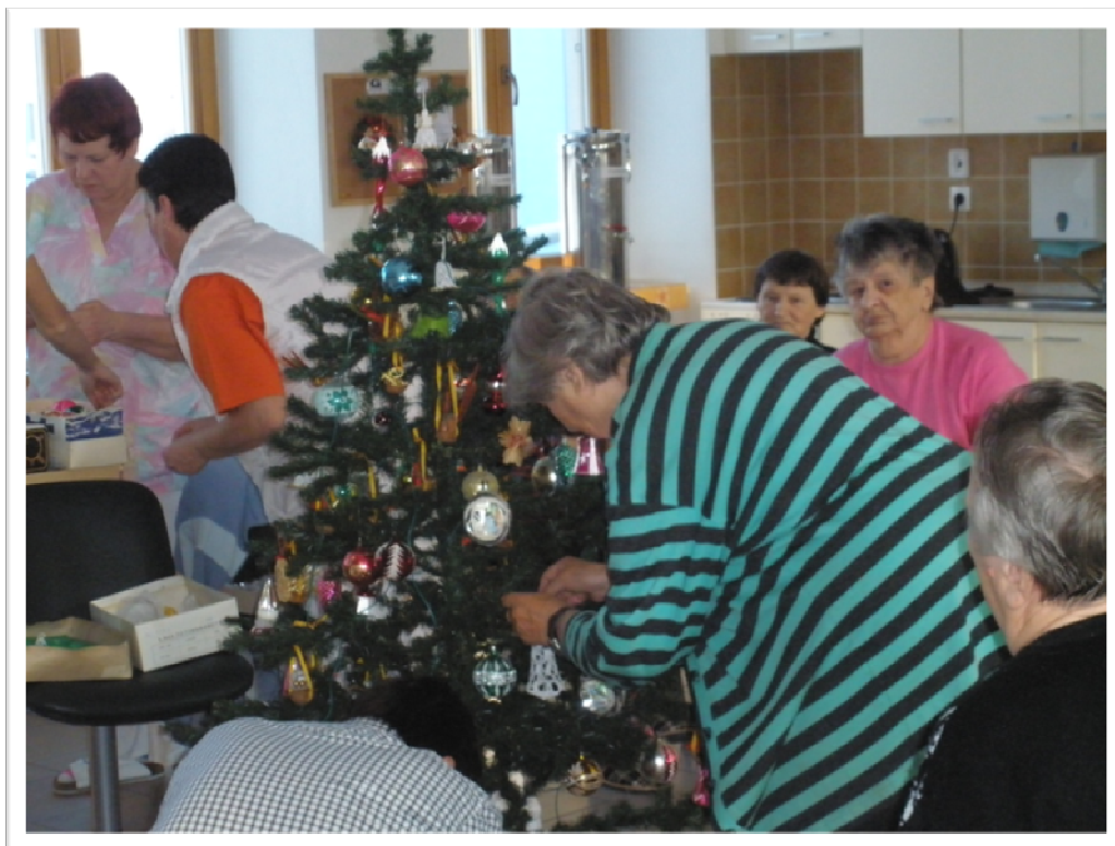
2. prosinec 2010 - Zdobení vánočního stroměčku, poslech vánočních koled