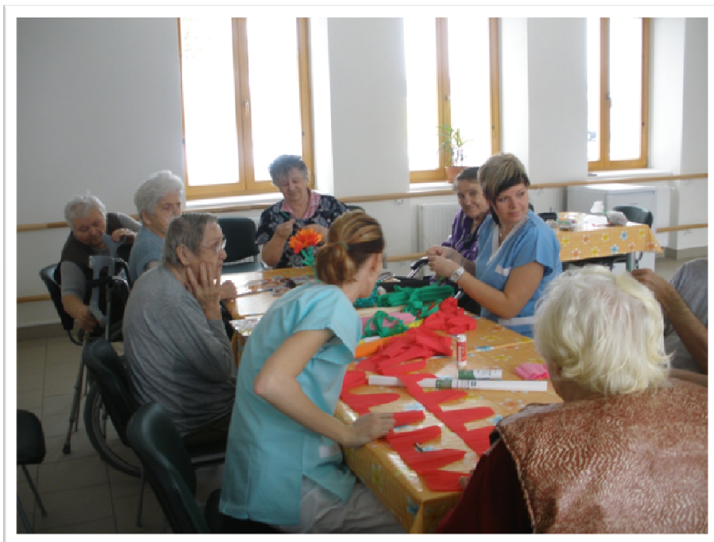
16. únor 2010 - Terapie s klienty „Tvoříme jaro“