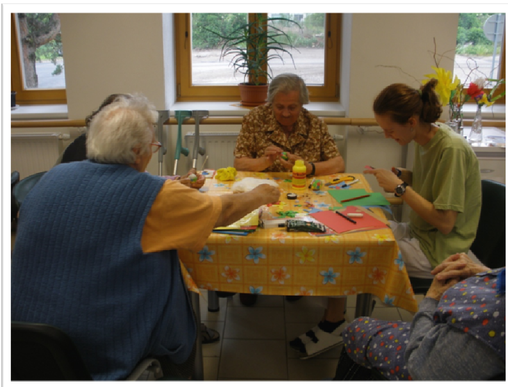
26. květen 2010 - Jarní terapie s klienty, výroba květin a dekorací z papíru