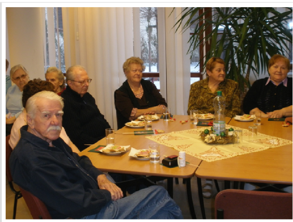
14. prosinec 2010 - „Vánoční besídka na DPS“ s vystoupením dětí z MŠ Habánská a ženského pěveckého sboru z Březí