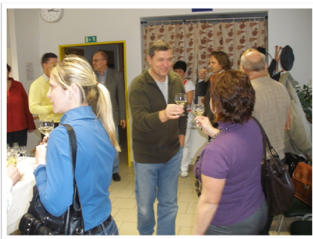
5. leden 2011 - 1. výročí zahájení provozu organizace, setkání s radními a zastupiteli