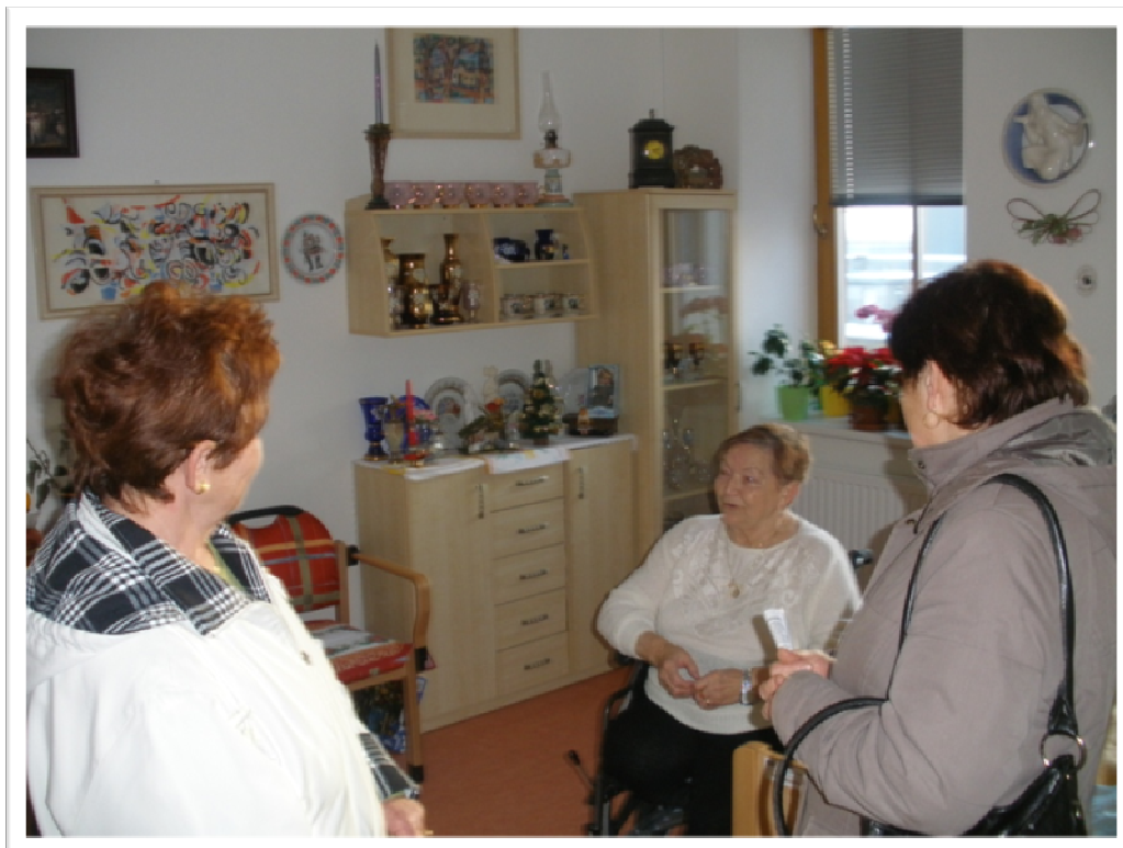
7. prosinec 2010 - Den otevřených dveří pro veřejnost a prohlídka zařízení