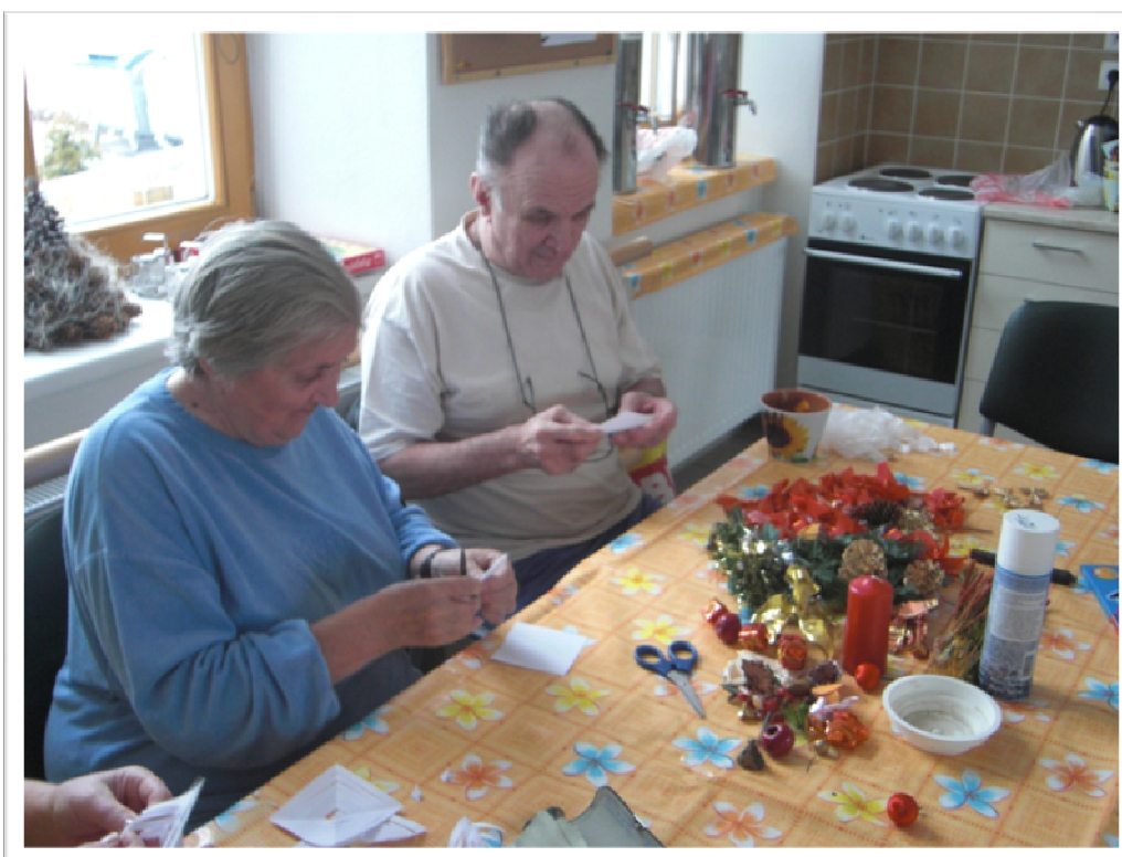
28. listopad 2010 - Přípravy na Vánoce, výroba vánočních ozdob a dekorací