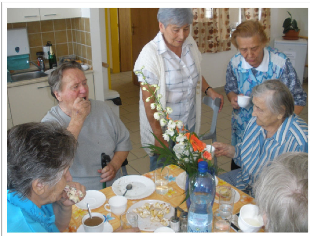
8. červenec 2010 - Oslava 90tých narozenin naší seniorky s rodinou a klienty