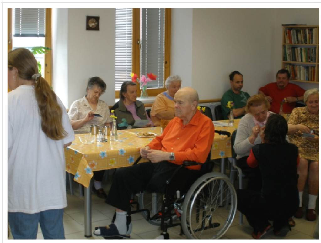
7. květen 2010 - „Den matek v G-centru“ s Biliculem, vystoupení a pestrý program