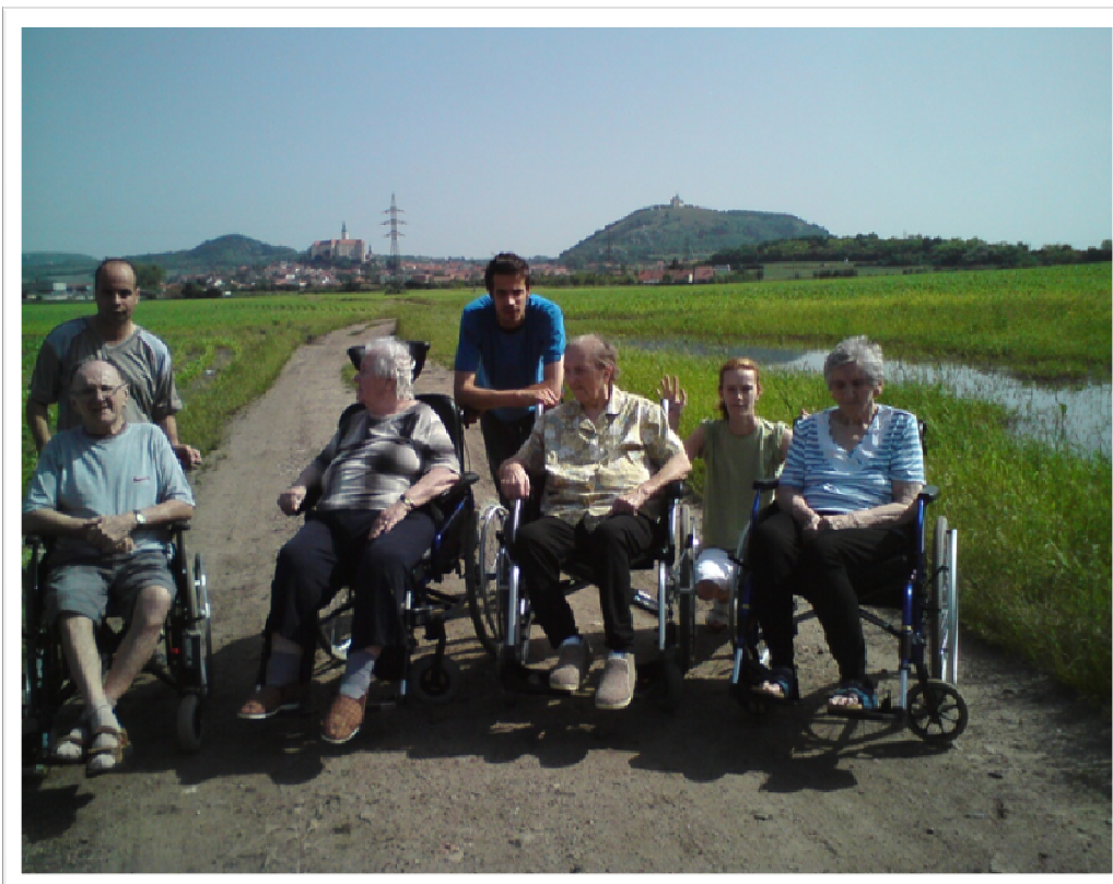
11. červen 2010 - Výlet s klienty Domova pro seniory po okolí G-centra