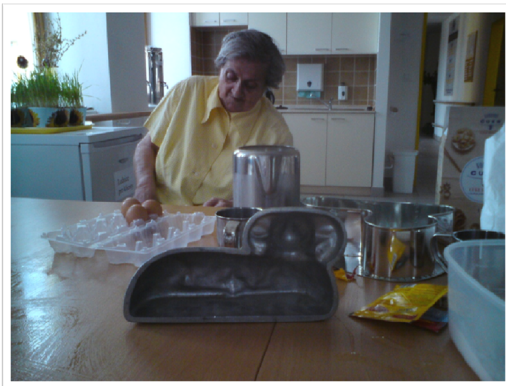
12. březen 2010 - Přípravy na Velikonoce, pečení beránka