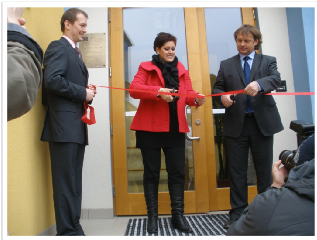
5. leden 2010 - Slavnostní otevření budovy G-centra a zahájení provozu