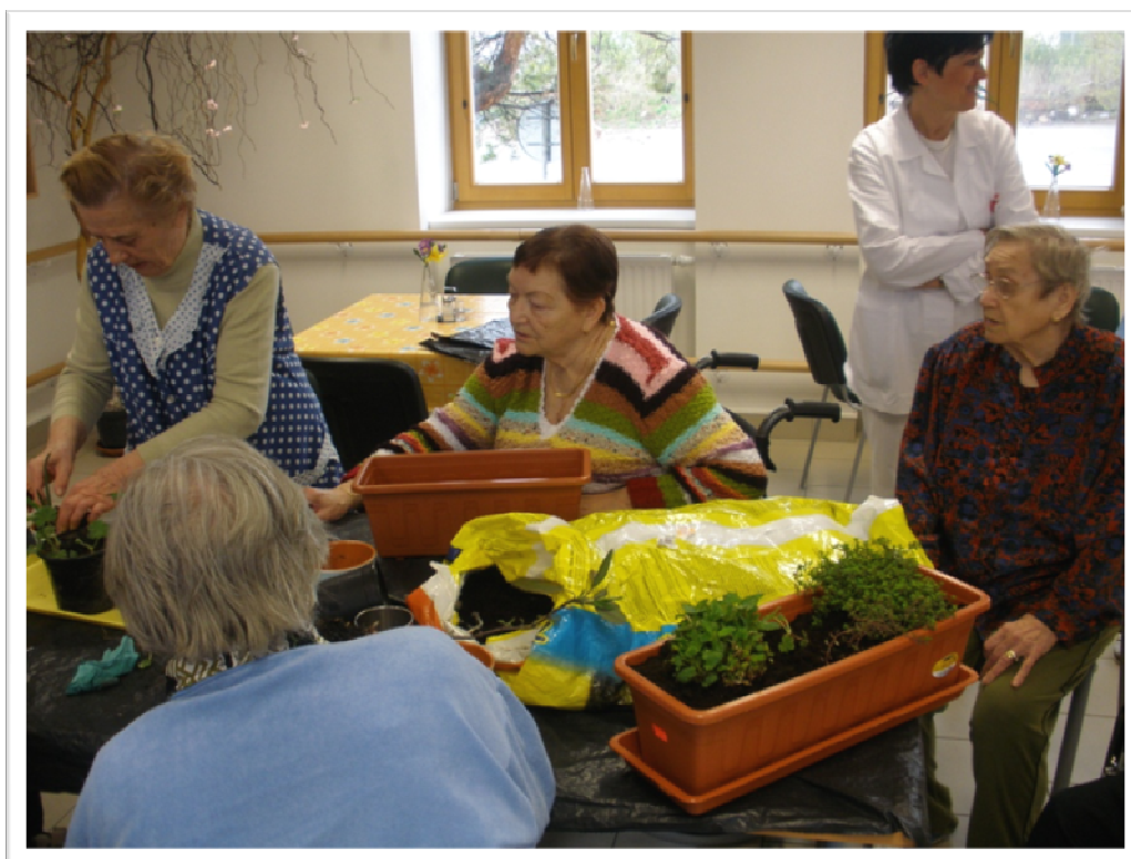
13. duben 2010 - Společné sázení bylinek a okrasných květin