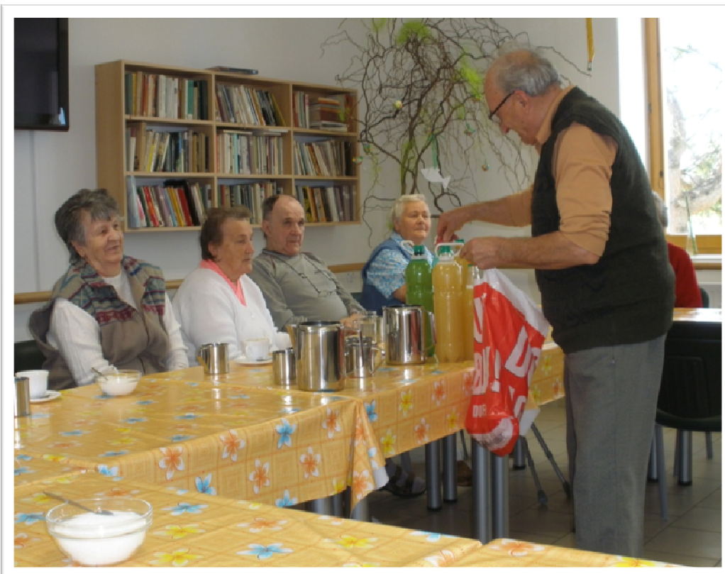
16. září 2010 - Vinobraní v G-centru s Klubem seniorů a ochutnávkou burčáku