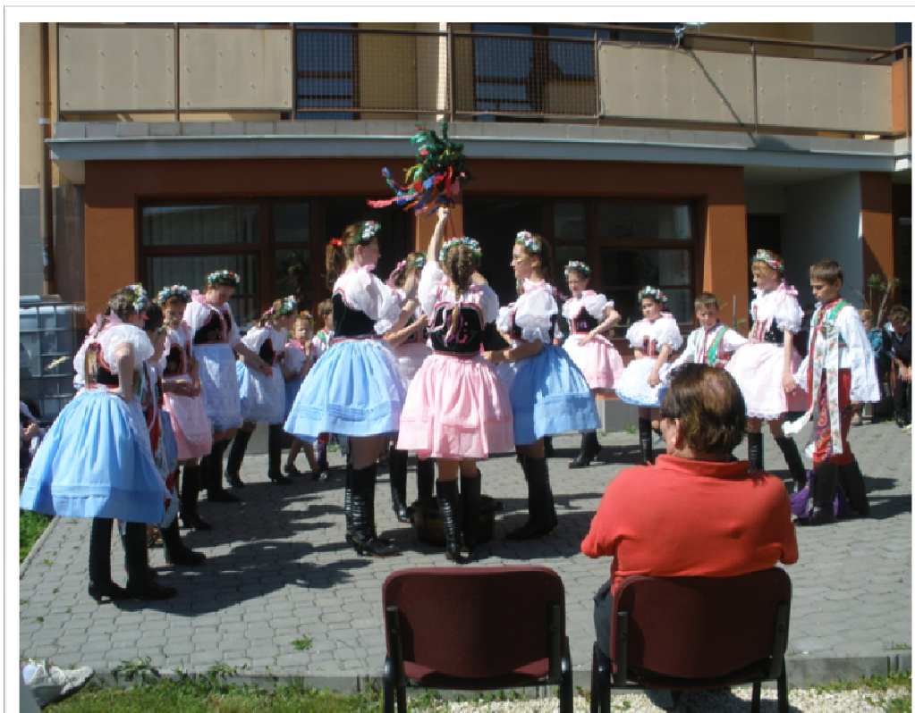
7. květen 2010 - „Den matek na DPS“ se souborem „Dunájek“ - tanec a zpěv