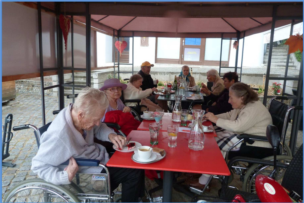
15. září 2018 - Výlet do Mikulova - návštěva cukrárny