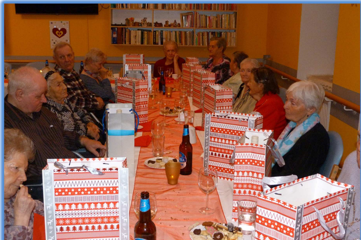
19. prosinec 2018 - Tradiční společná slavnostní „Štědrovečerní“ večeře