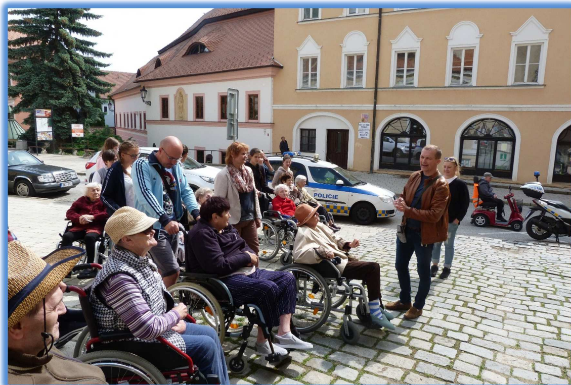
18. květen 2018 - Výlet do Mikulova - návštěva kostela sv. Václava