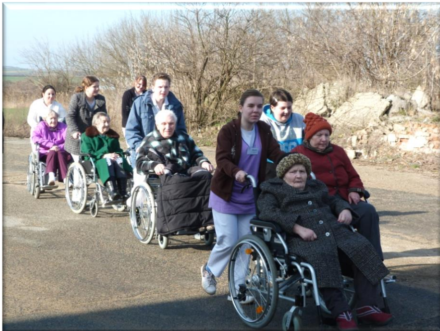
11. březen 2013 - Jarní procházka s uční SOU