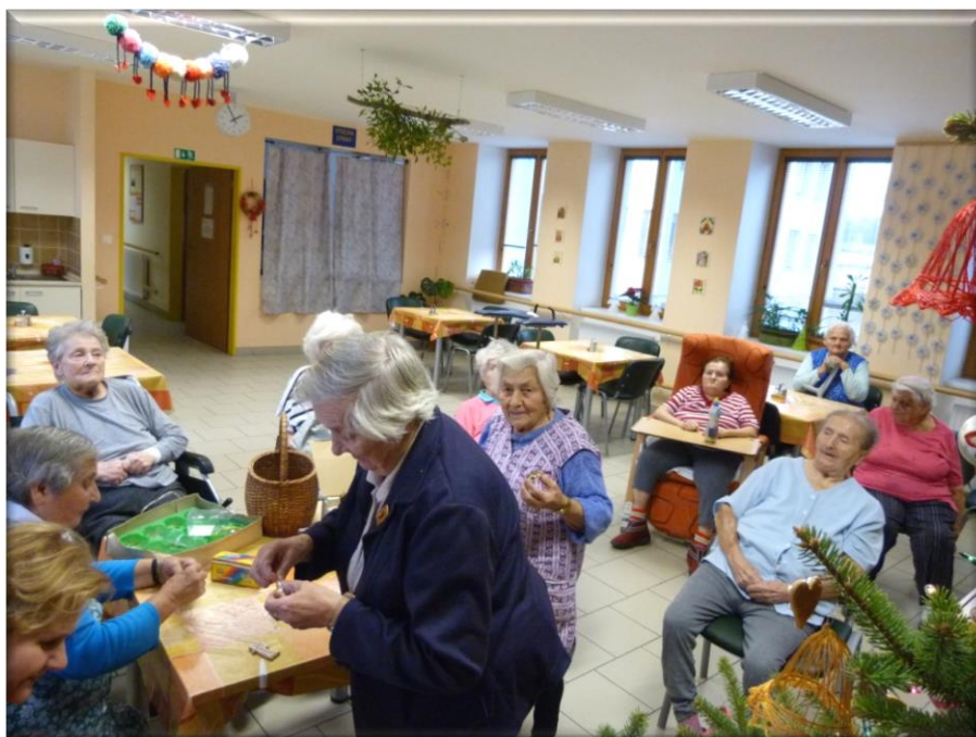
17. prosinec 2013 - Zdobení vánočního stromku