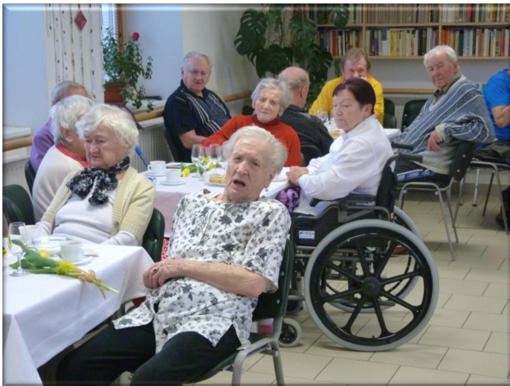
8. březen 2013 - Oslava MDŽ - vystoupení zpěvaček z Klentnice