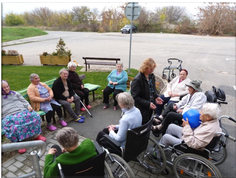
25. říjen 2013 - Společné venkovní posezení