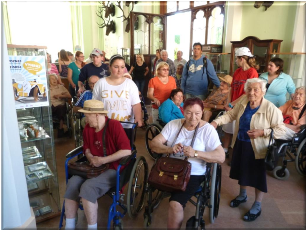
14. červen 2013 - Výlet do Lednice - návštěva státního zámku