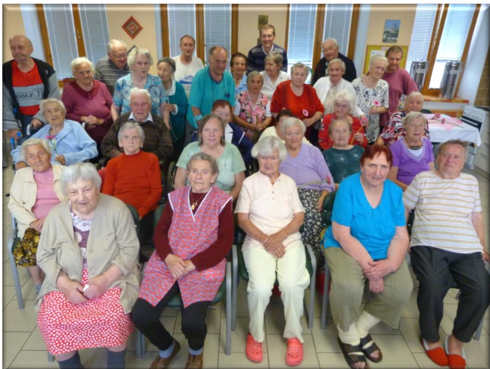
26. červen 2013 - shromáždění s ředitelem