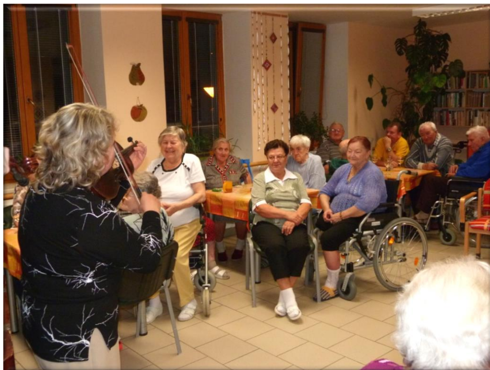
22. listopad 2013 - Vystoupení cimbálovky Kasanica