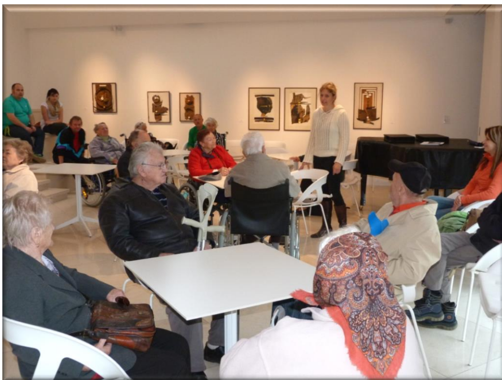
31. květen 2013 - Výlet do Mikulova , návštěva Galerie Závodný