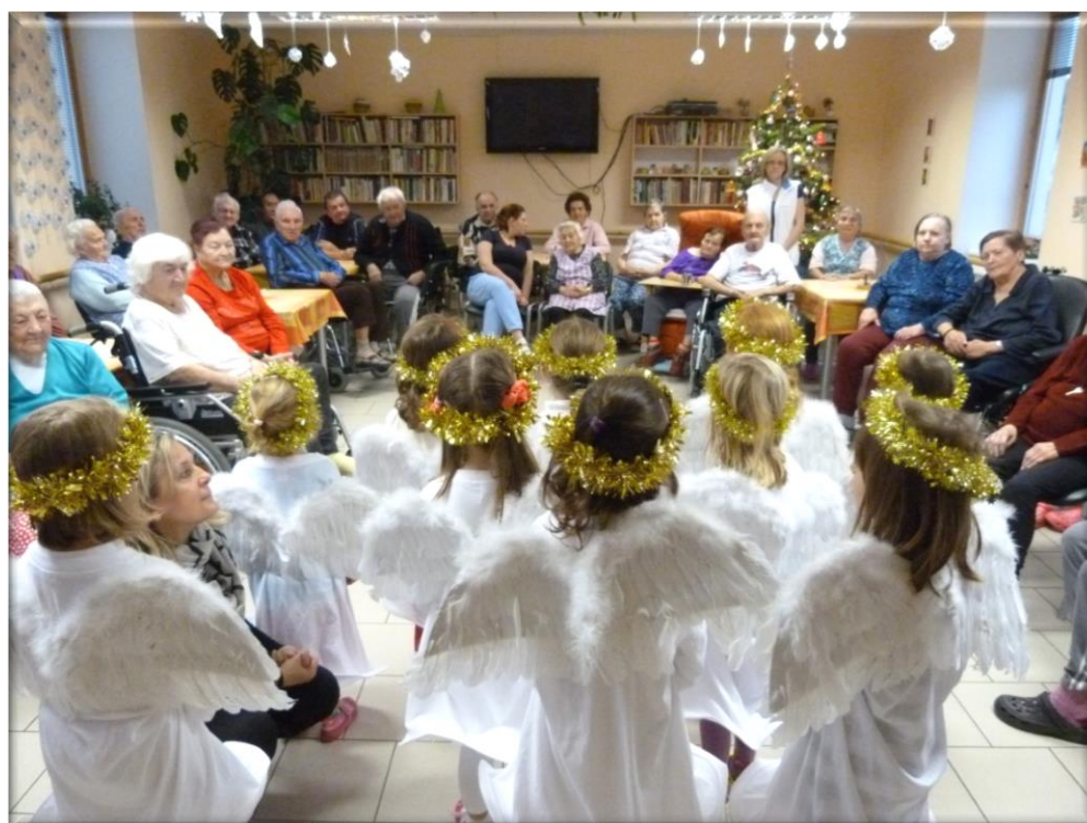
19. prosinec 2013 - Vánoční vystoupení dětí MŠ Sluníčko