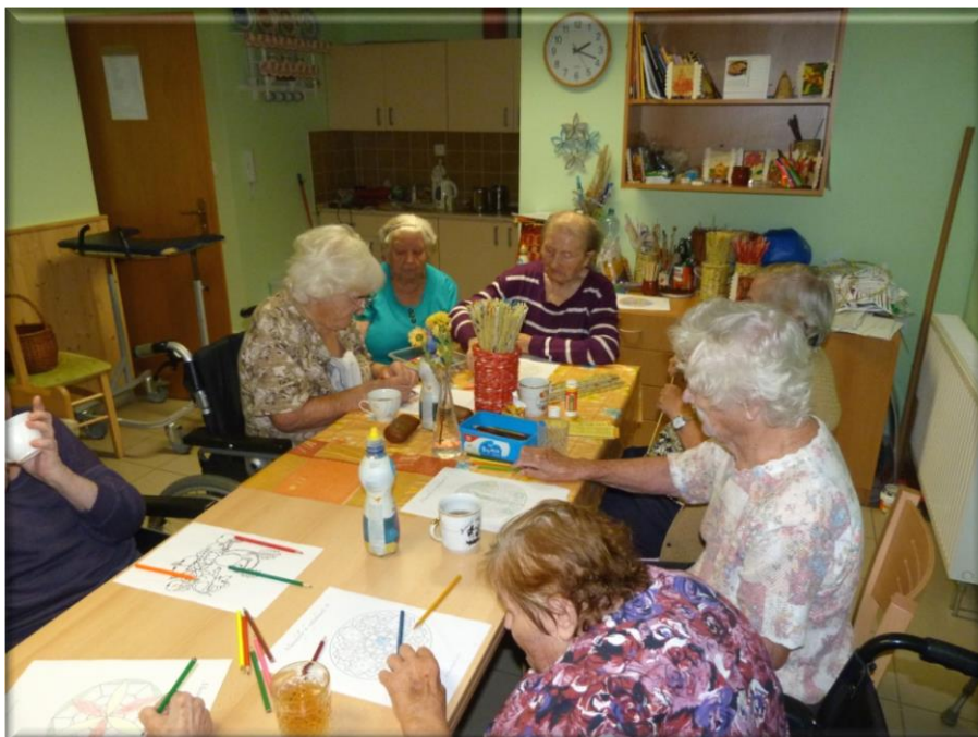
7. listopad 2013 - Odpolední tvořivá aktivita